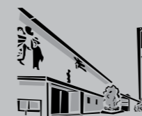
Hl. Dreifaltigkeit Rot / Zazenhausen