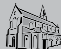
St. Antonius Zuffenhausen