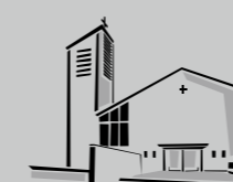
Zum Guten Hirten / Buon Pastore Stammheim