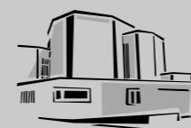
St. Laurentius / Nossa Senhora de Fatima Freiberg