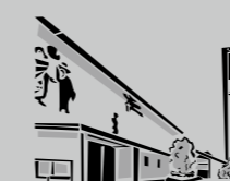
Hl. Dreifaltigkeit Rot / Zazenhausen