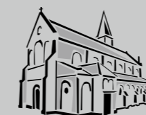
St. Antonius Zuffenhausen

Orario Ufficio martedì 15.30 – 19.00 Uhr mercoledì su app. telefonico