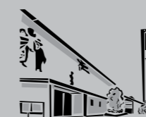
Hl. Dreifaltigkeit Rot / Zazenhausen