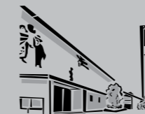
Hl. Dreifaltigkeit Rot / Zazenhausen