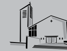
Zum Guten Hirten / Buon Pastore Stammheim

Fanno parte di questa comunità gli italiani residenti nelle zone con i seguenti codici postali: 70378 Mönchfeld, 70435 Zuffenhausen, 70437 Freiberg/Rot, 70439 Stammheim, 70469 Feuerbach, 70499 Giebel/Weilimdorf Orario Ufficio P. Daniele mercoledì 16.00 – 19.00 o su appuntamento telefonico