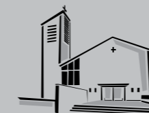
Zum Guten Hirten / Buon Pastore Stammheim

Alles in allem also erweist sich der E-Roller mitsamt seinen Lasten als die gesellschaftlich innovativste Kraft zur Veränderung des bewegten Zeitgenossen Richtung Einfach, Gleichschritt und Stillstand. Ein upgrade der Humanität, dem niemand aus dem Weg gehen sollte. mg