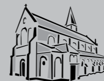
St. Antonius Zuffenhausen