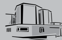
St. Laurentius / Nossa Senhora de Fatima Freiberg