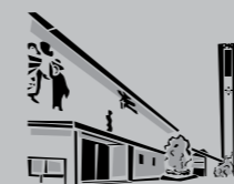
Hl. Dreifaltigkeit Rot / Zuffenhausen